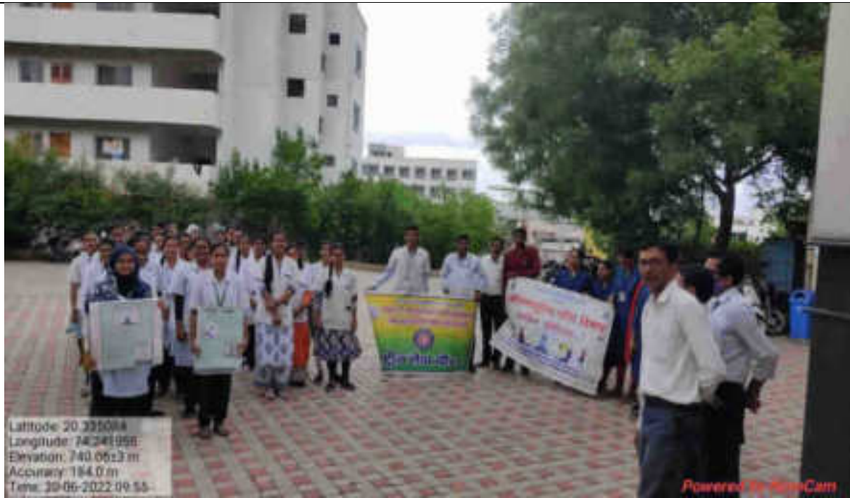
Start of Yoga Rally