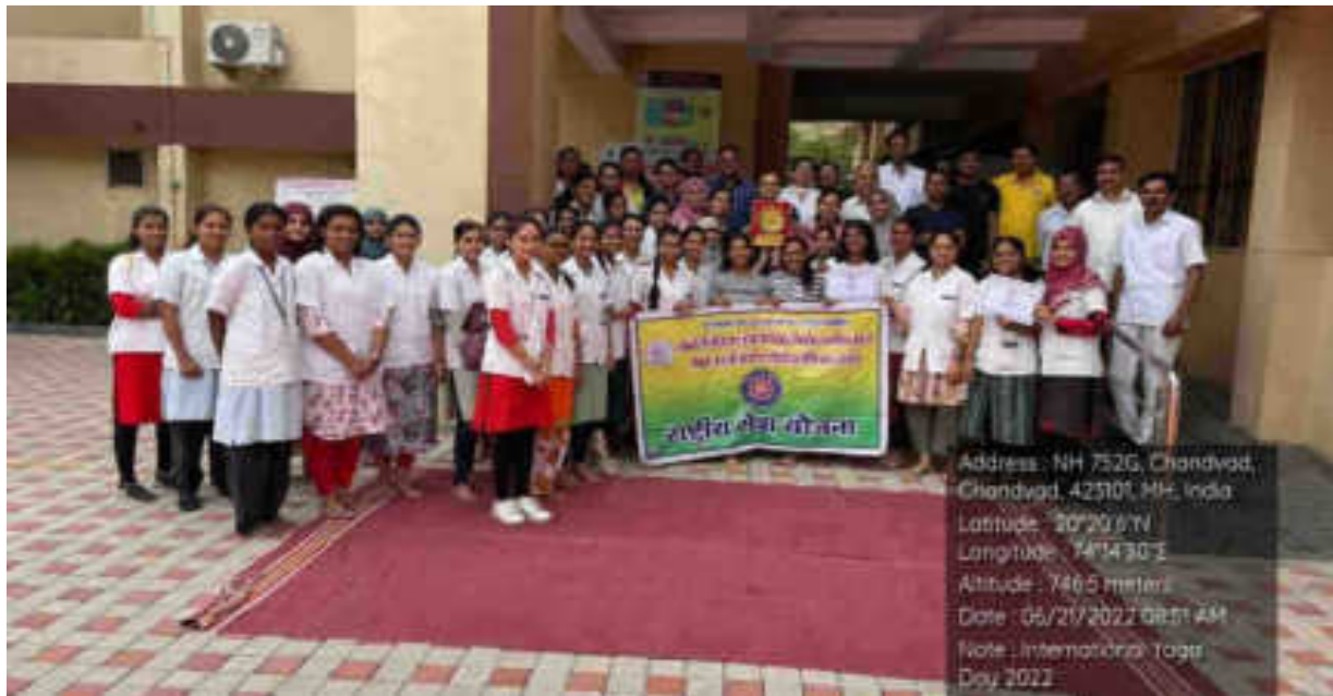
Best NSS Unit Award: Smt. K B Abad Homoeopathic Medical College Chandwad!!