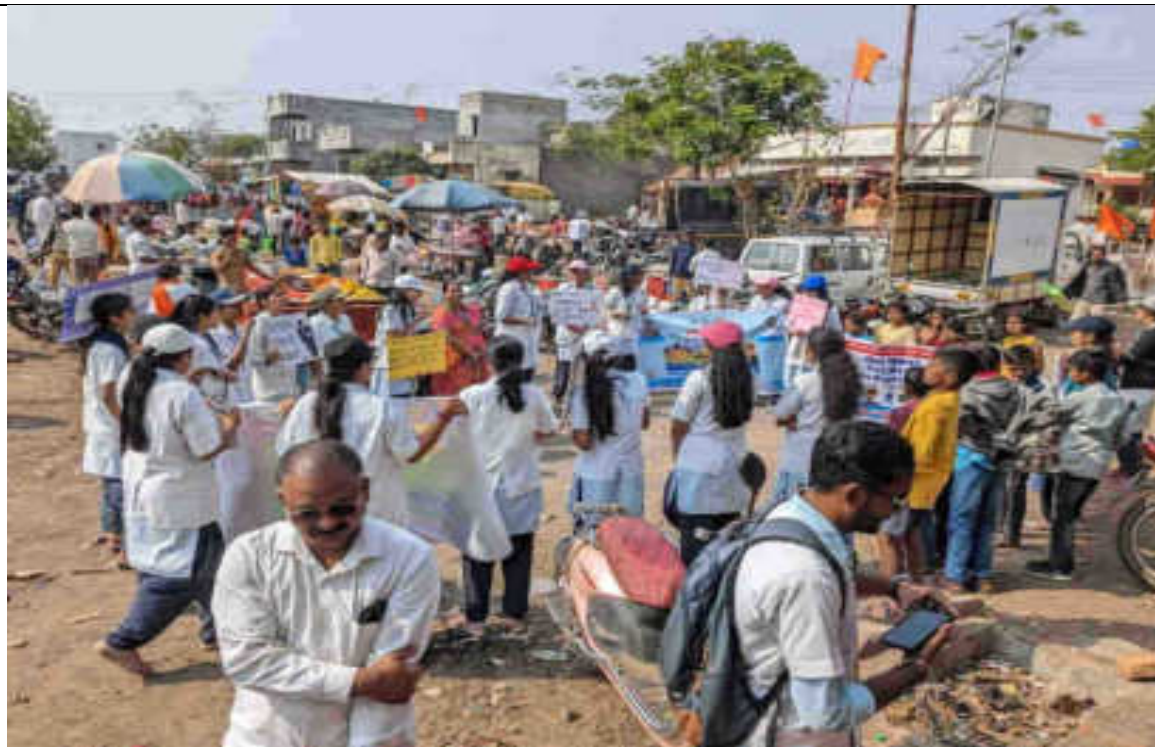
International Ahimsa Diwas