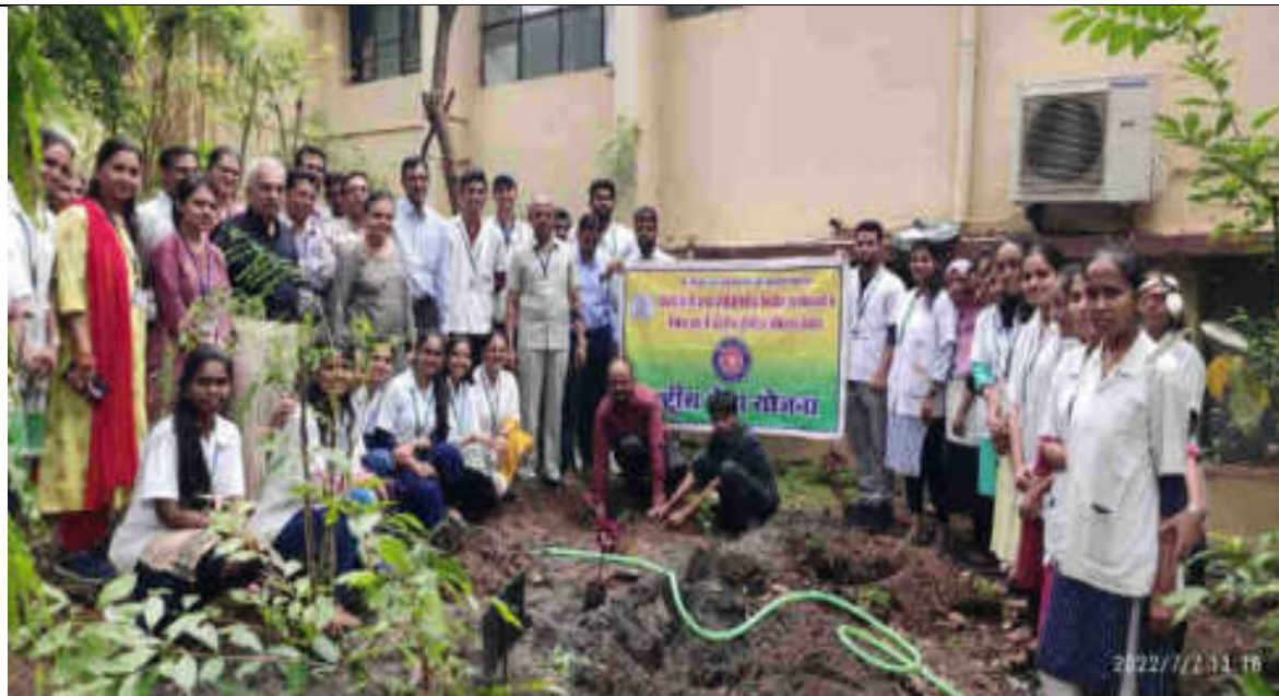
Tree Plantation: 01/07/2022