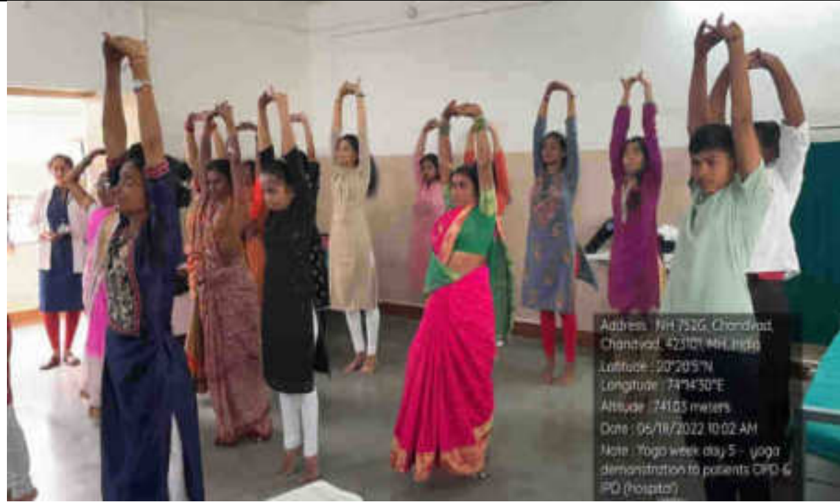
People practicing Yogasana