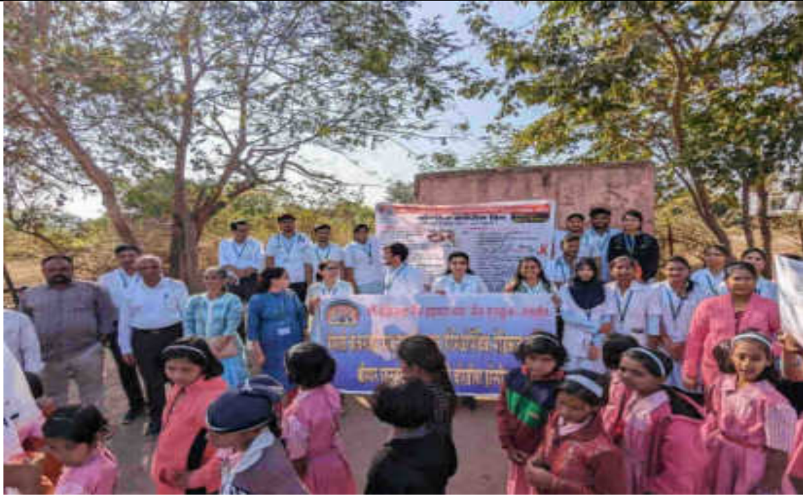
Free Women's cancer detection Camp