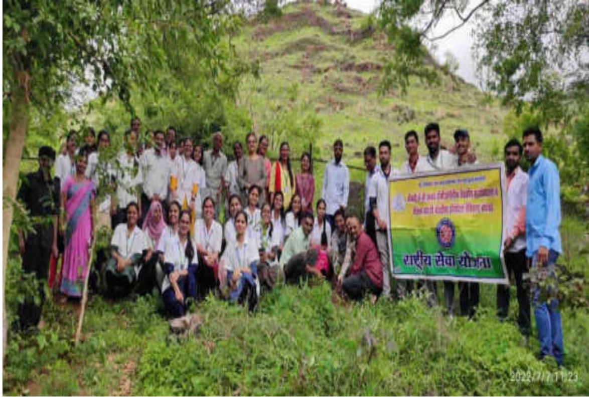
Blood Donation Camp 07/07/2022