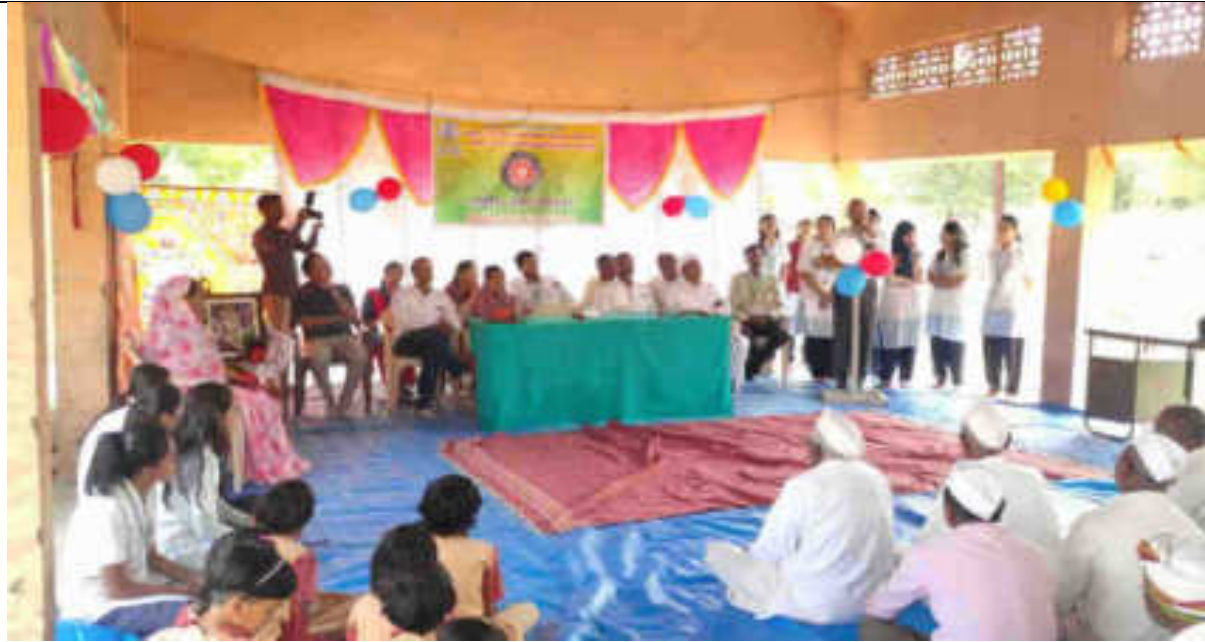
Speech by NSS Volunteer: Experience Sharing of Camp