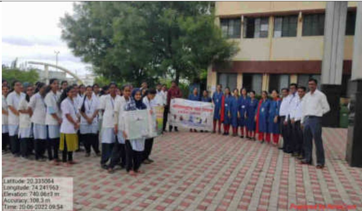
Rally Through Chandwad