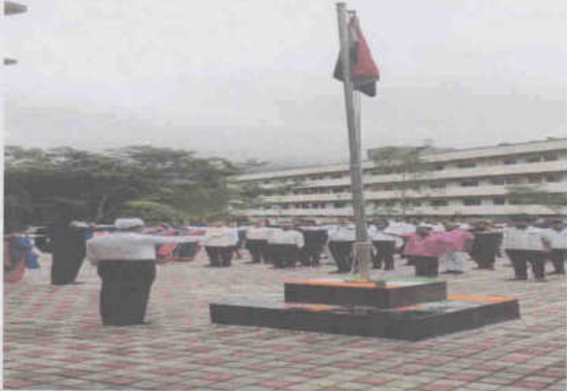
Pledge on Indian Tricolor.