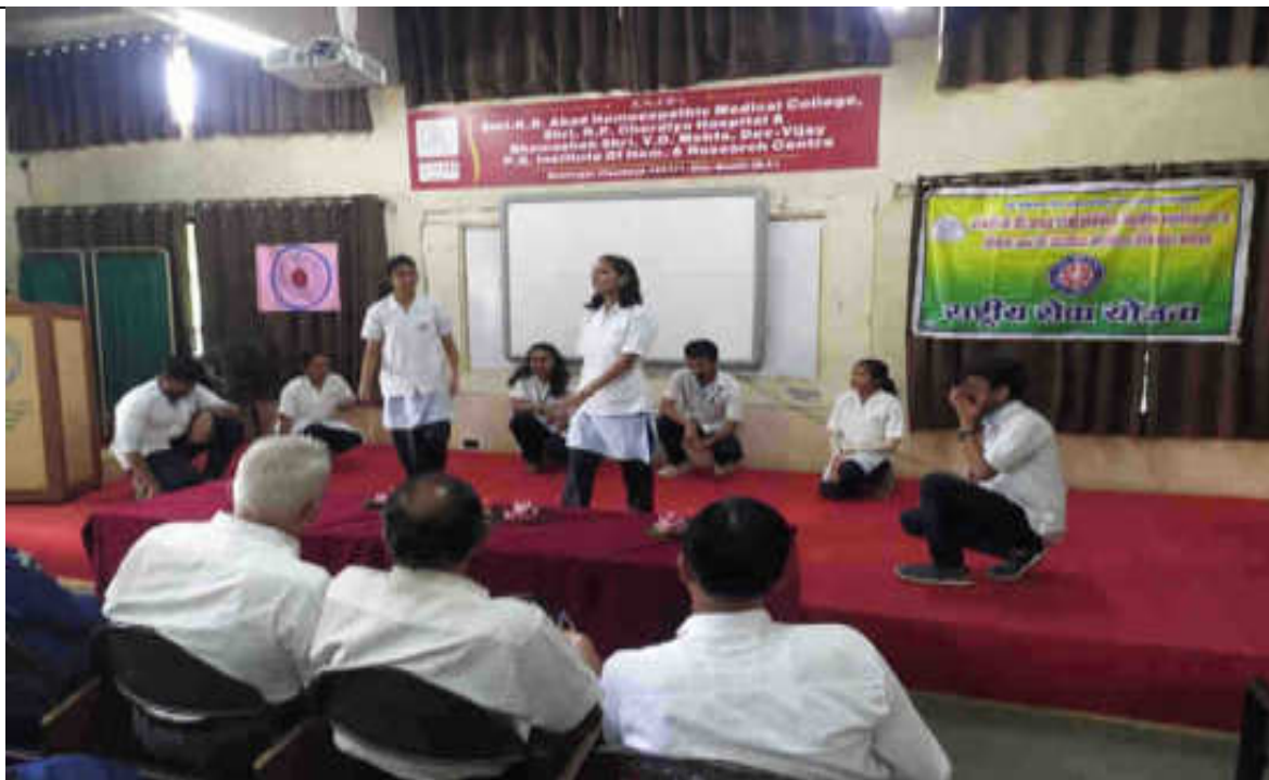
Gender Sensitization skit