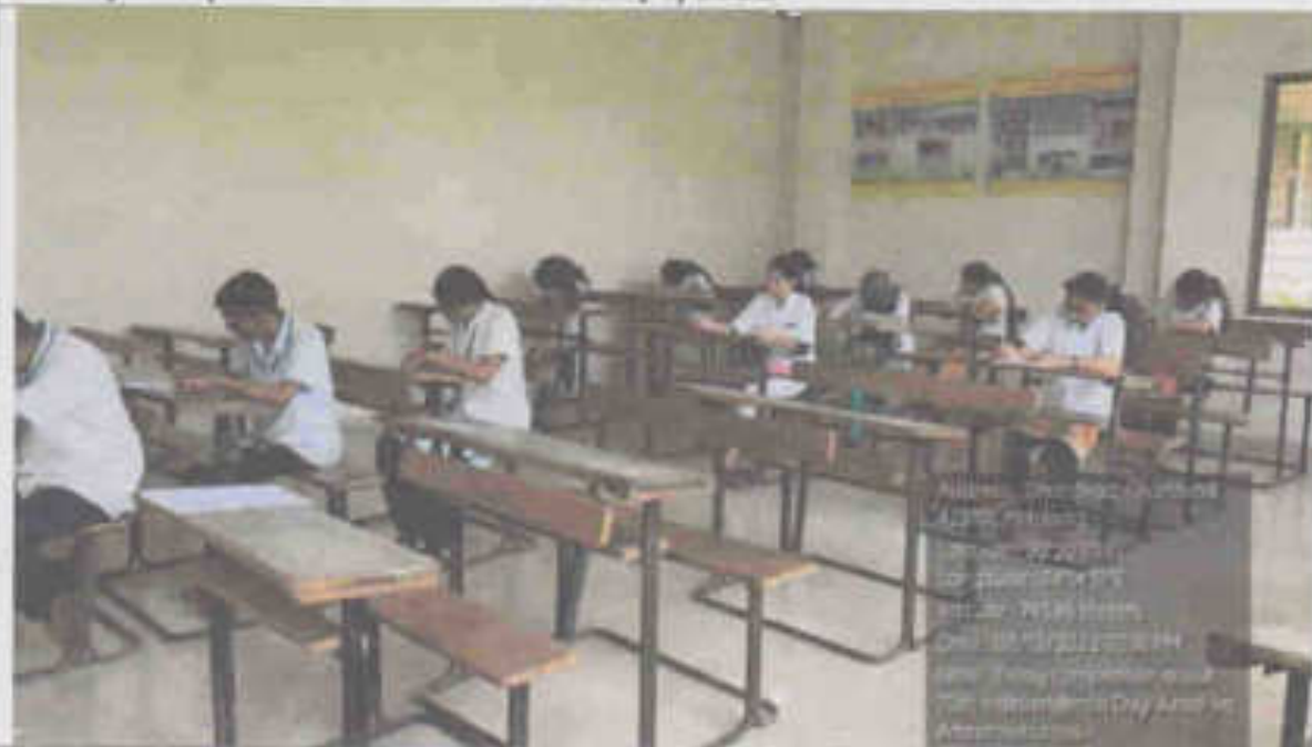
Essay Competition: Patriotism Dt. 12/8/2022