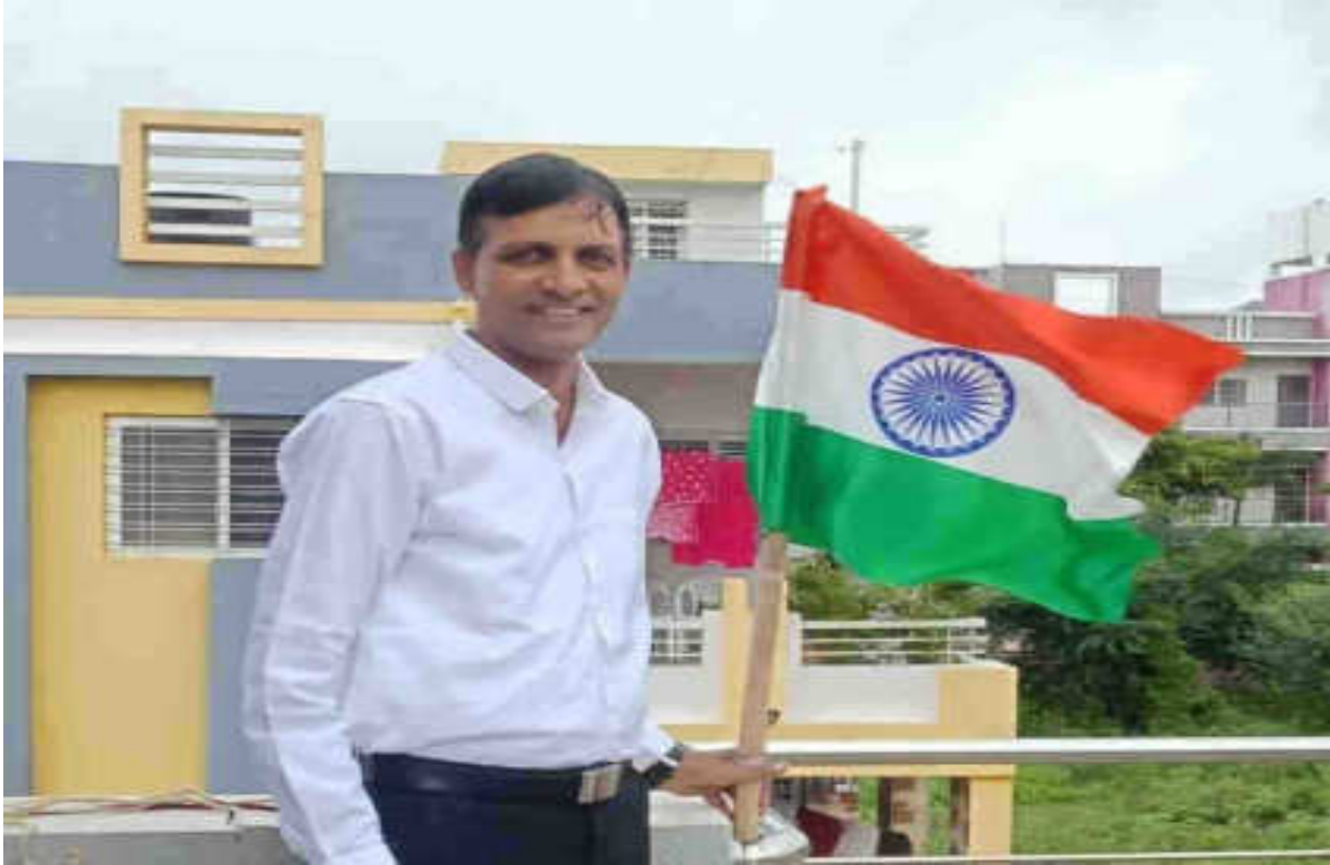
Har Ghar Tiranga activity on 13/08/2022