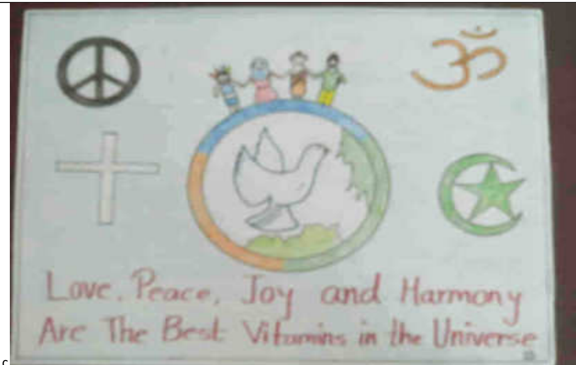
Communal Harmony Week: 19 to 26 Nov 2022