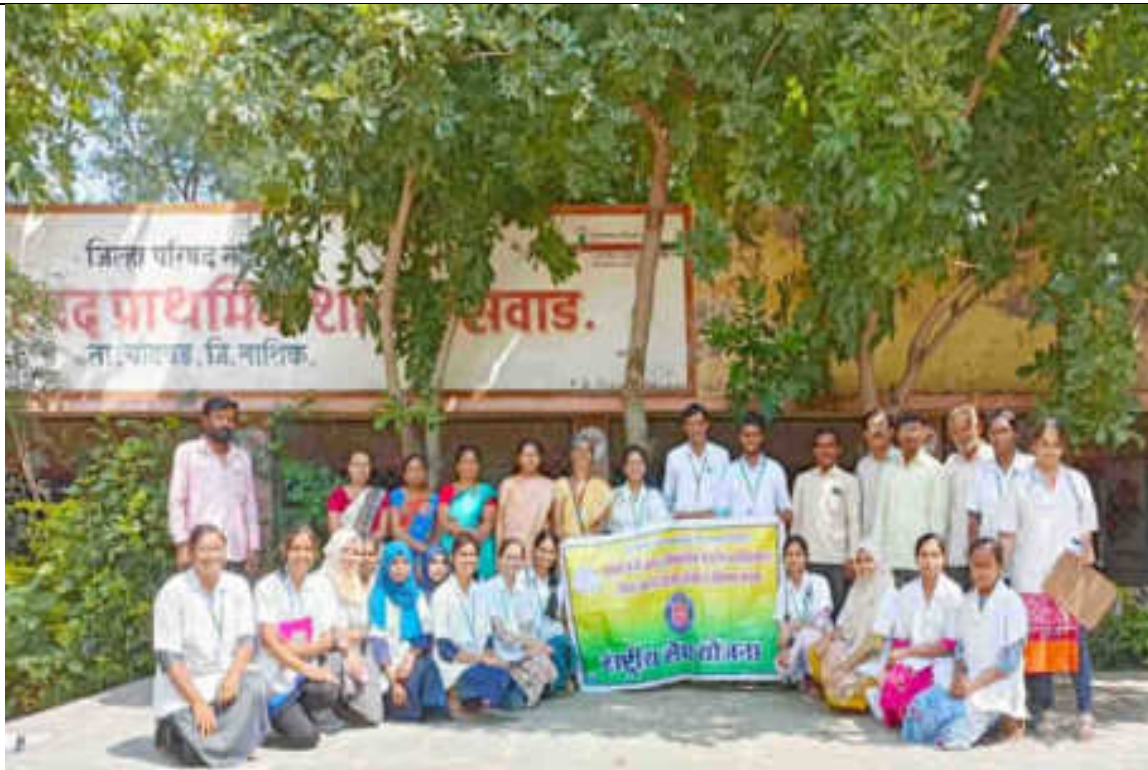
Workshop on Vaccination Awareness