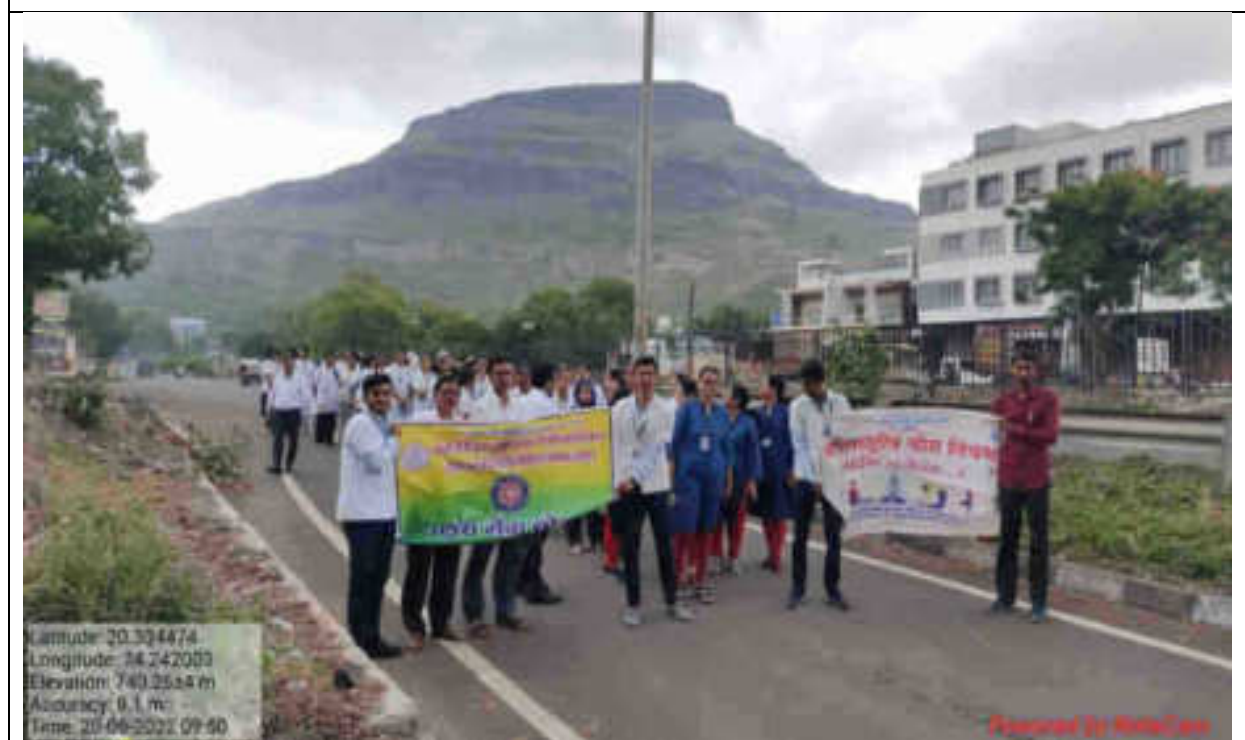
Yoga Awareness Rally With Slogan