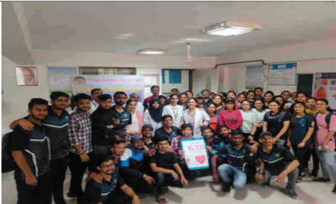
Swachata Abhiyaan : 25/08/2022 to 6/9/2022