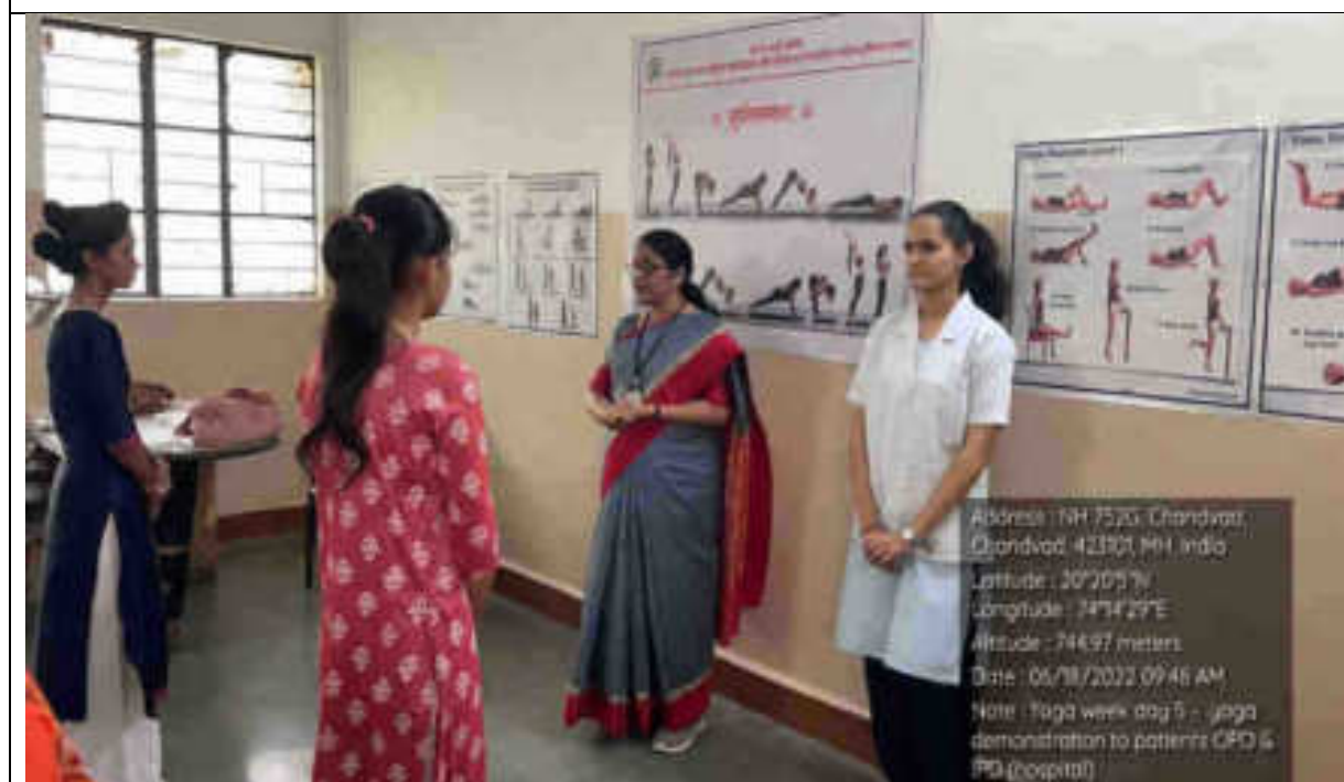
Yoga For Patients