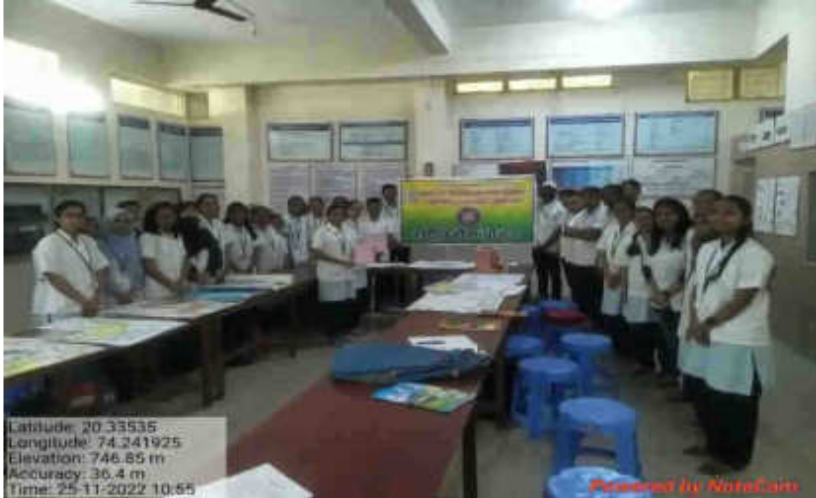
Bhartiya Samvidhan Diwas: 26/11/2022