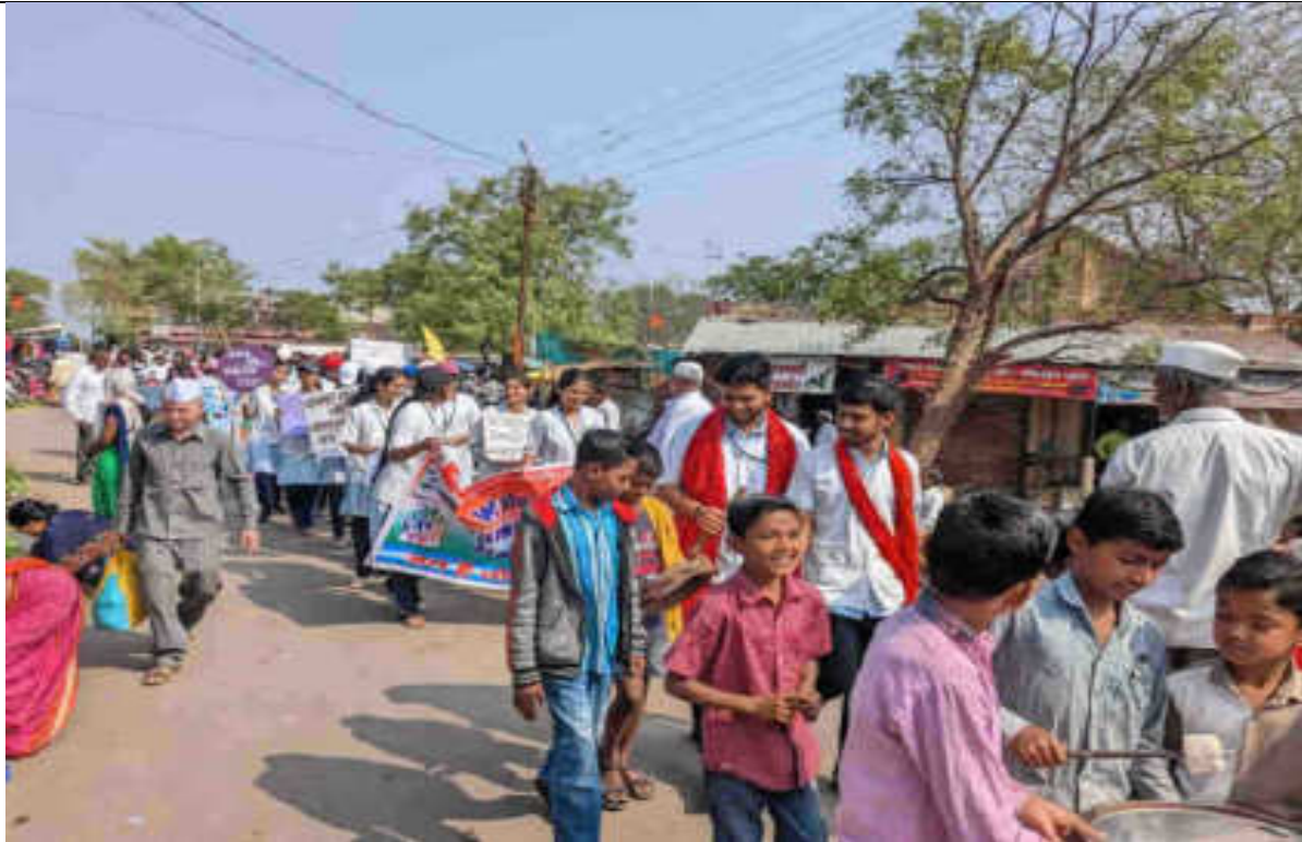
Cancer Awareness & Menstrual Hygiene activity