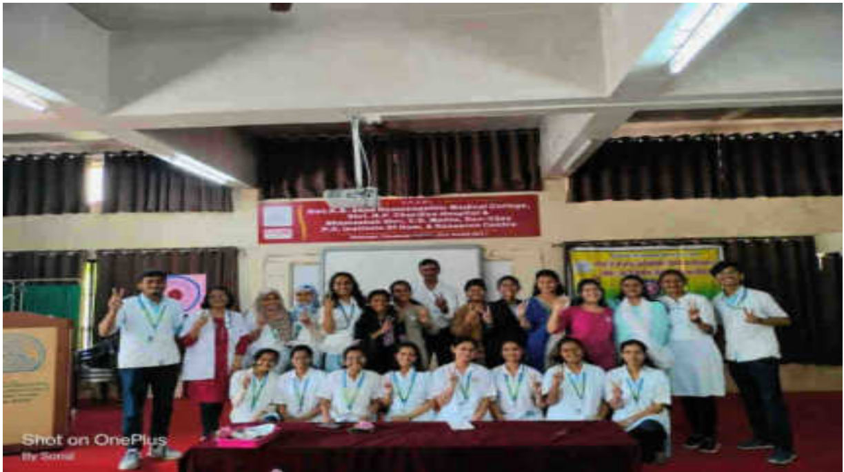
NSS song by volunteers