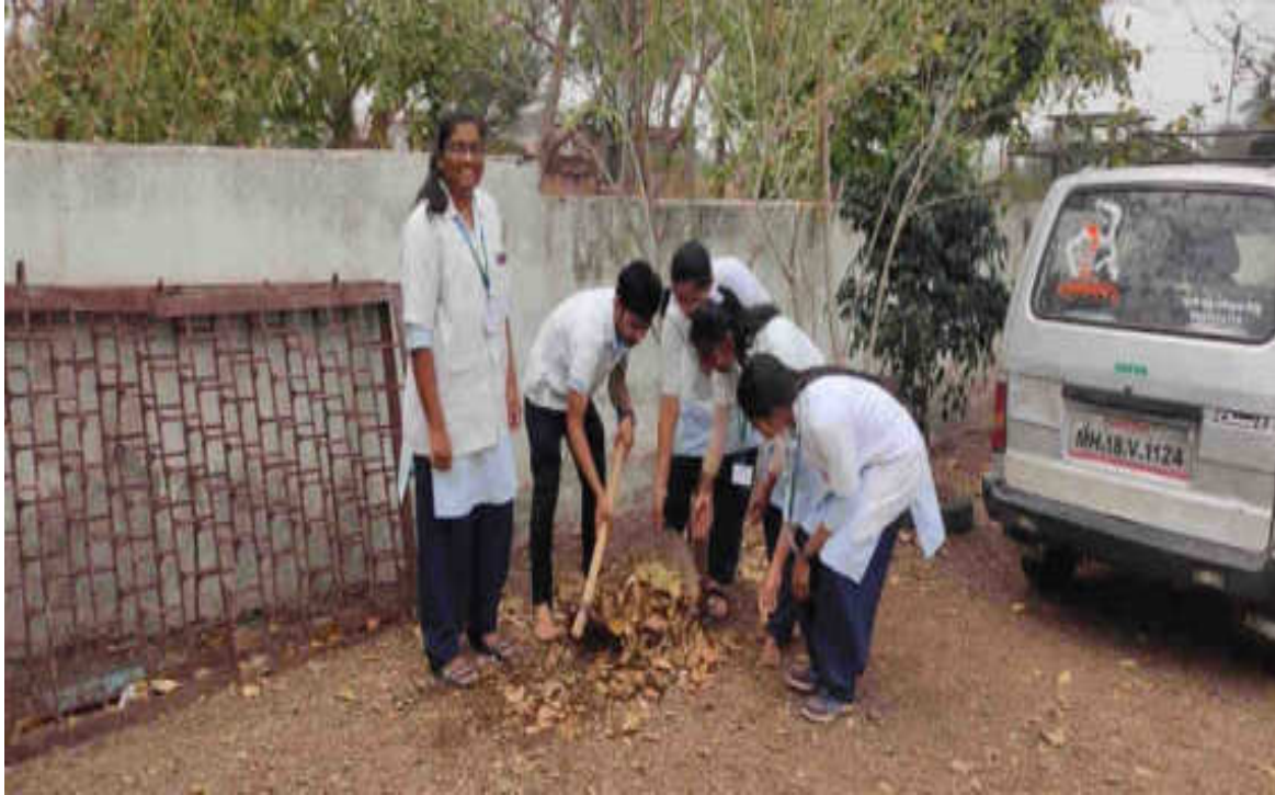
Independence Day: 15/08/2022