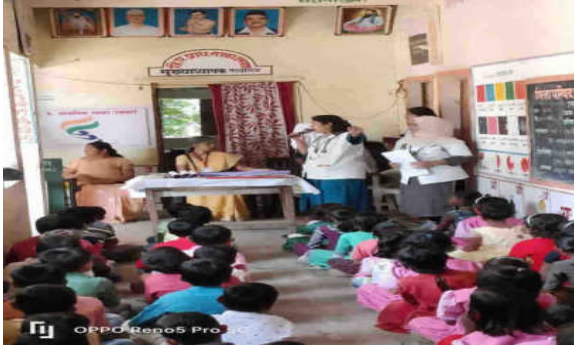
Rashtriya Ekta Diwas: 31/10/2022