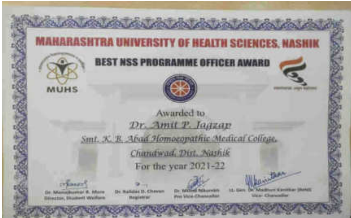
Certificate of NSS award