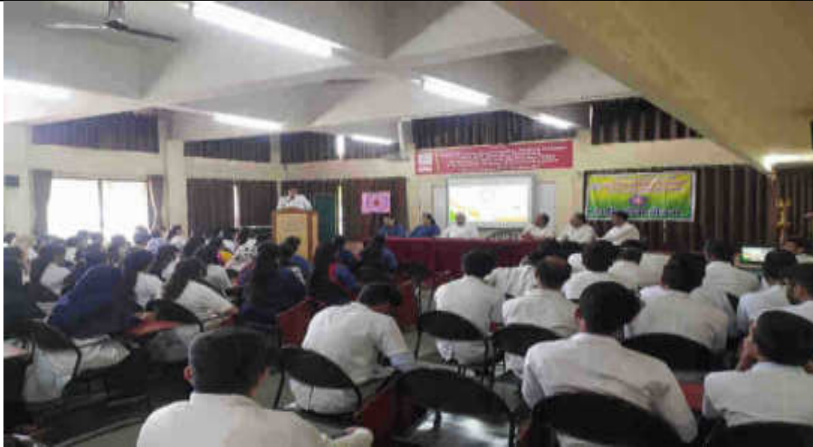
Drama on Accident awareness by volunteers